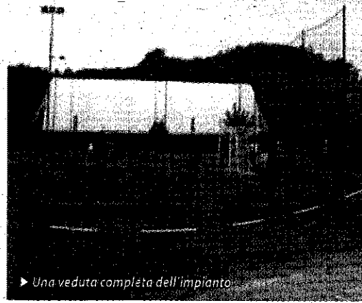
► Una veduta completa dell'impianto

PAGINA A CURA DI FRANCESCA SEFRRAZZA PAPA